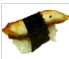
Nigri Aal Fisch Anzahl: .....