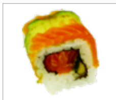
Rainbow Lachs Anzahl: .....