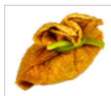
Tofu-Tasche Tofu-Tasche Anzahl: .....