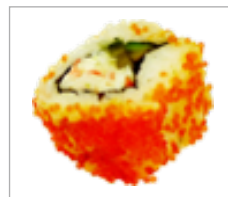
Uramaki Krabbe, Avocado, Orange Fischeiern Anzahl: .....