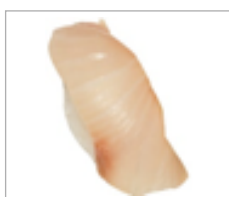
Nigri Kingsfisch Anzahl: .....