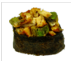
Gunkan Aaltarta Avocado, smoked Aal Anzahl: .....