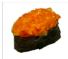
Gunkan Lachs Anzahl: .....