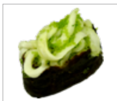
Gunkan Tintenfisch Anzahl: .....