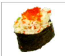
Gunkan Krabbe Anzahl: .....