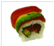
Rainbow Thunfisch Anzahl: .....