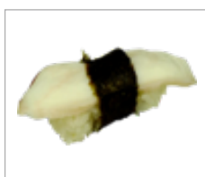
Nigri Oktopus Anzahl: .....