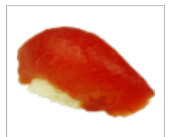
Nigri Thunfisch Anzahl: .....