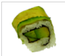
Vegi Avocados Avocado Anzahl: .....