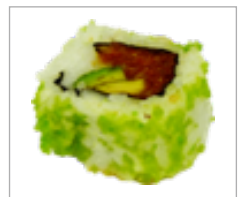
Uramaki Geräucherter Lachs, Avocado, Fischeier Anzahl: .....