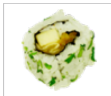
Uramaki Chinakohl, Apfel, Koriander Anzahl: .....