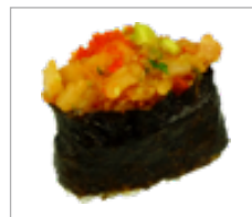
Gunkan Thunfisch Anzahl: .....