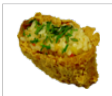
Gunkan, Vegi Inari Tofu gemischt Anzahl: .....