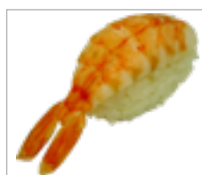
Nigri Krevetten Anzahl: .....