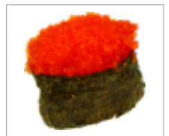
Gunkan Rote Fischeier Anzahl: .....