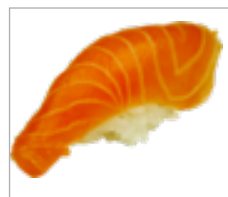
Nigri Lachs Anzahl: .....