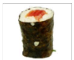
Maki Sushi Lachs, Thon, Gurke oder Rettich Anzahl: .....