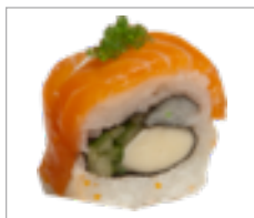
Uramaki Mozzarella, Lachs Anzahl: .....