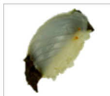
Nigri Tintenfisch Anzahl: .....